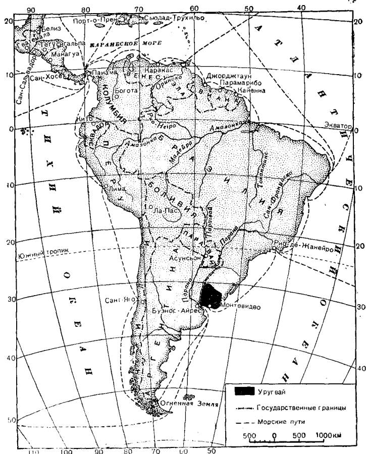
Положение Уругвая на материке Южная Америка

В 1917 году Уругвай под давлением Соединенных Штатов предоставил американскому военно-морскому флоту право использовать свои порты и гавани. Аналогичный «акт самоубийства», как указывает латиноамериканская печать, Уругвай совершил и в период второй мировой войны. Стремясь закрепиться в бассейне Ла-Платы, США, несмотря на возражения Аргентины, добились получения от Уругвая территории для организации военных и морских баз.